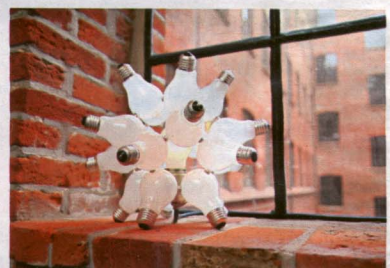
Galaktisch Sternenförmig ums eigentliche Leuchtmittel gebaut